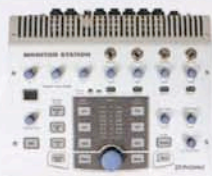
PreSonus Monitor Station